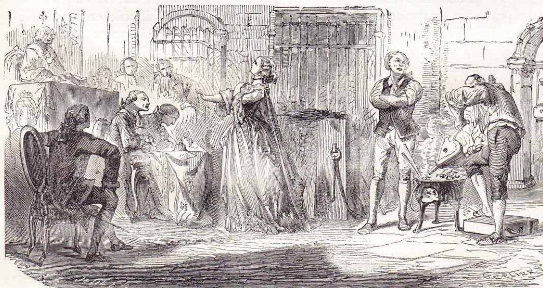
Procès du collier (1784).

expédients ne prolongèrent son ministère que de quelques jours, et le 16 août 1788 il fut obligé de décréter que les paiements de l'État n'auraient plus lieu que moitié en espèces et moitié en bons du Trésor. Alors ce fut une panique générale ; on se souvenait trop du papier-monnaie du temps de Law, et tout le monde s'attendait à la banqueroute. Brienne, à bout de ressources, dut céder la place à Necker qui avait